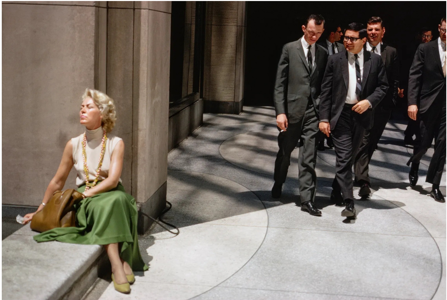
New York, 1966.