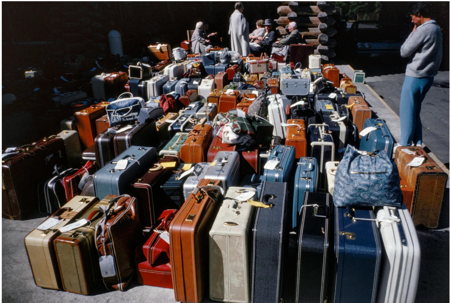
Lieu inconnu, 1964.