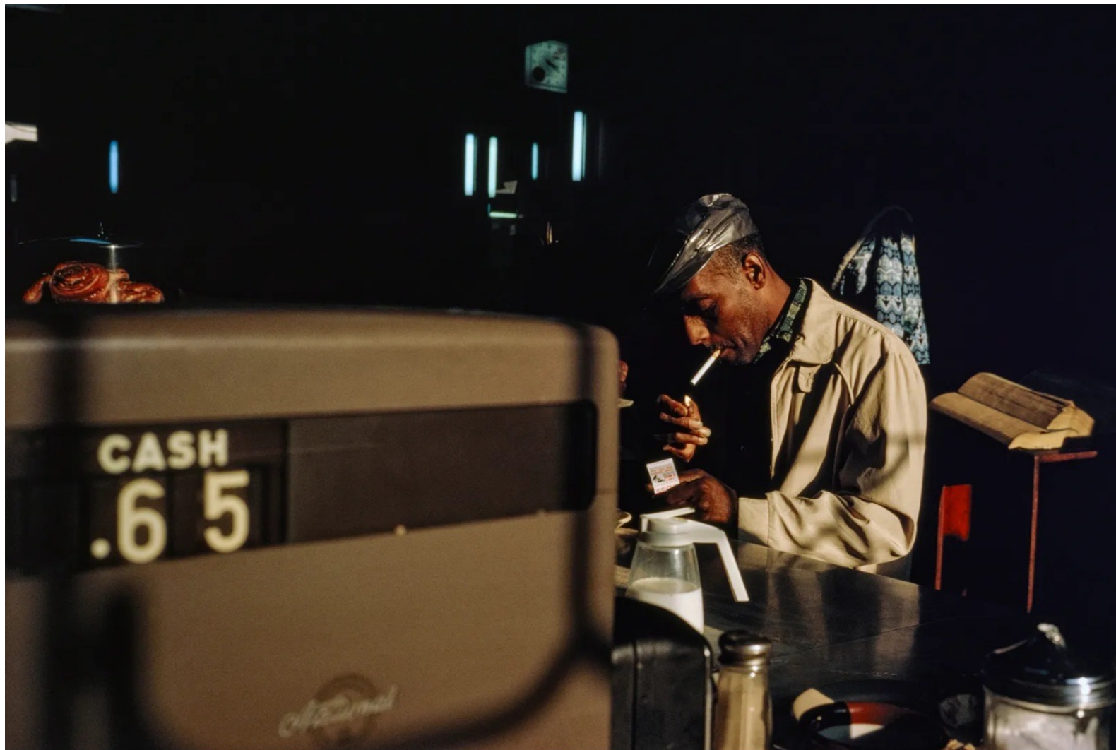
New York, 1966.