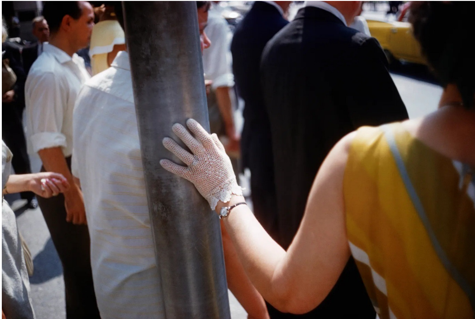
New York, 1961.