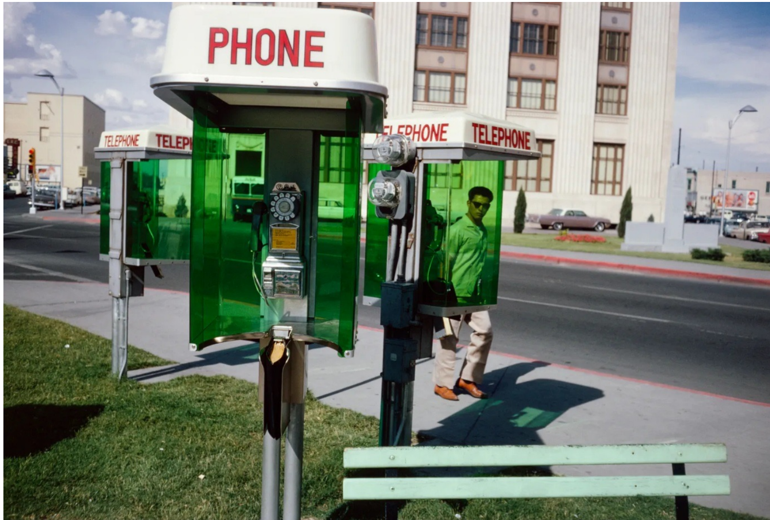
El Paso, Texas, 1964.