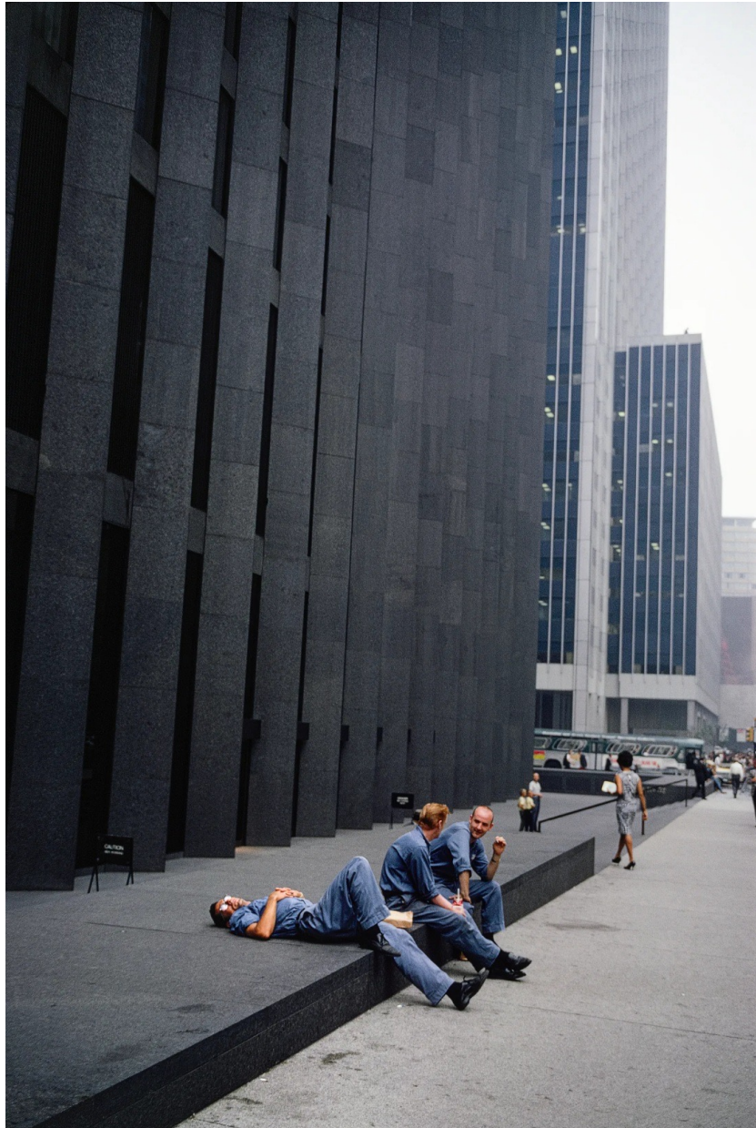
New York, 1966.