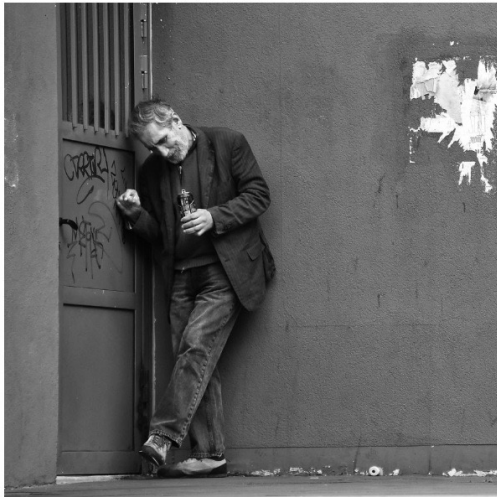
Maudite porte (François Serre)