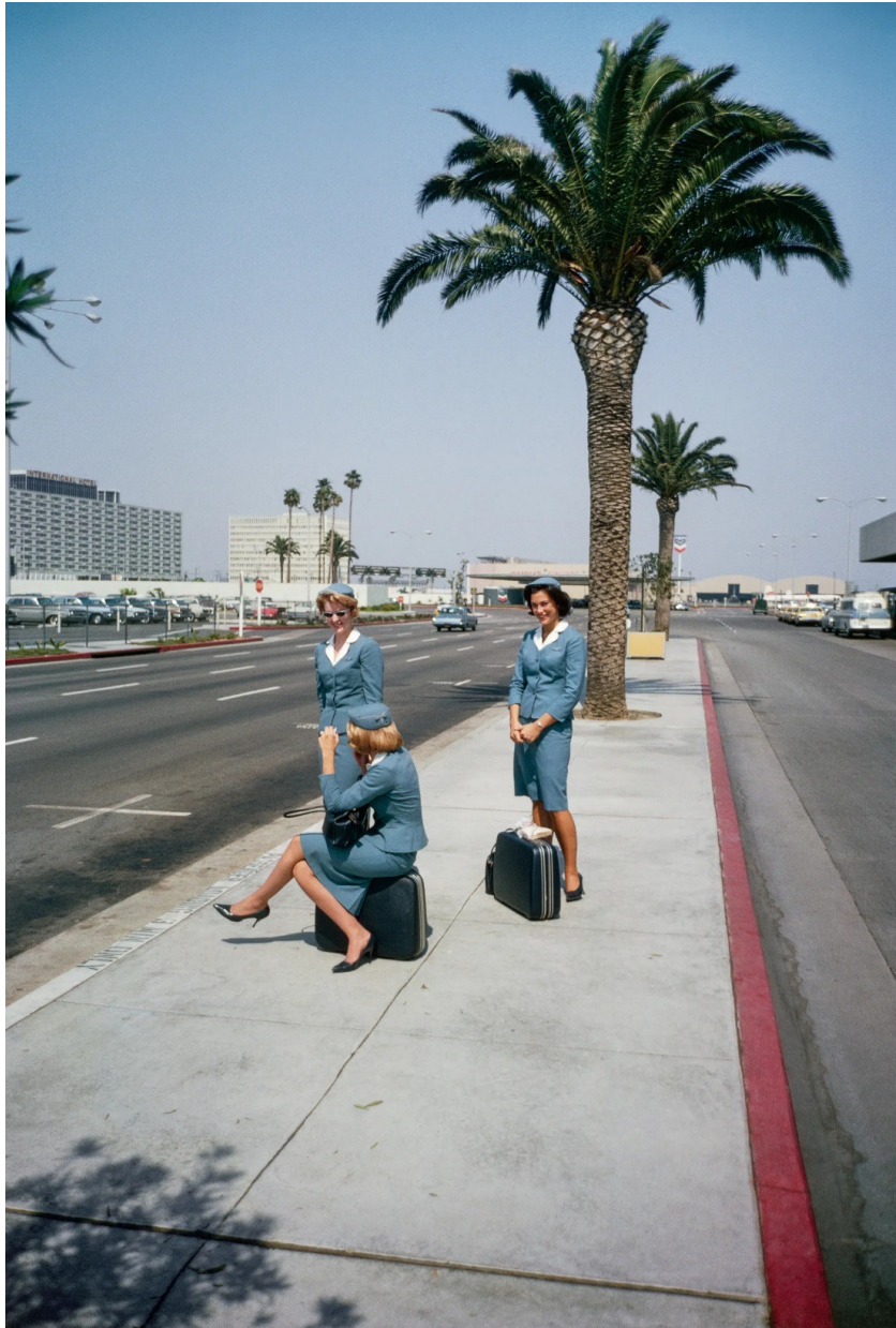
Aéroport international de Los Angeles, 1964.