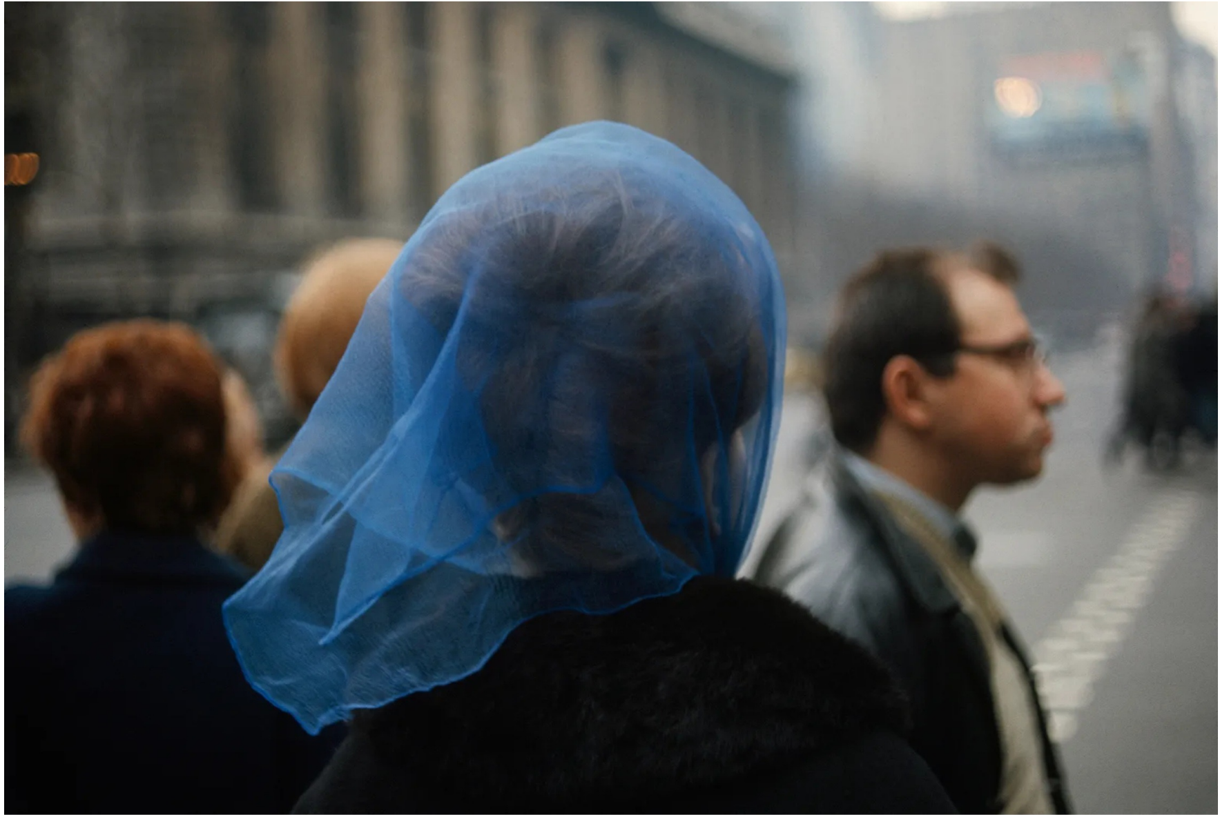
New York, 1966.