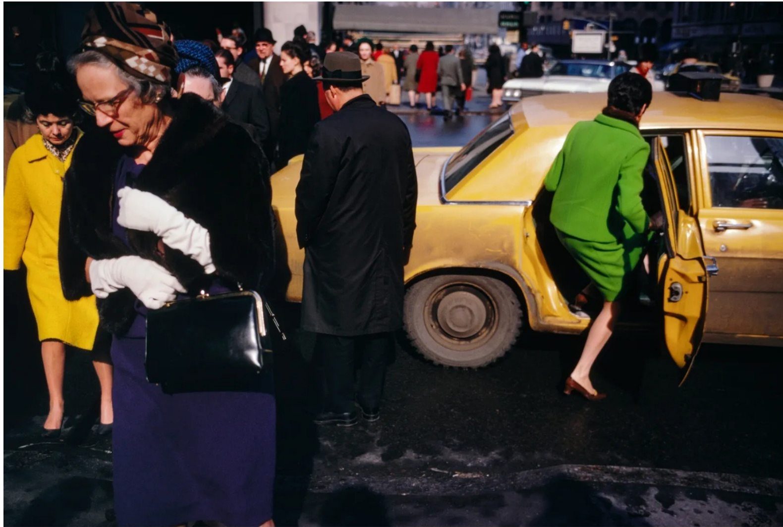
New York, 1967.